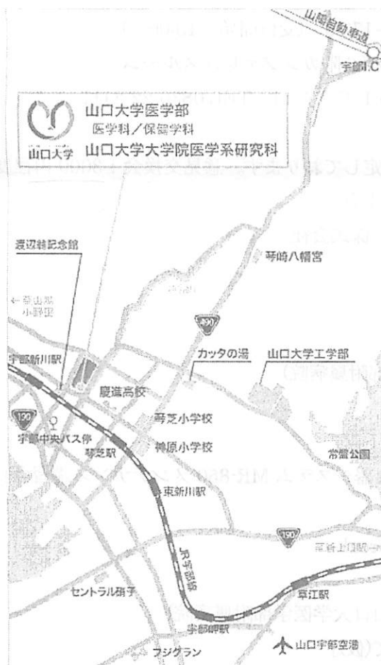
図1 山口大学医学部周辺図

【会場】 山口大学医学部附属病院 第2病棟6階カンファレンスルーム 〒755-8505 山口県宇部市南小串1丁目1-1 TEL 0836-22-2111